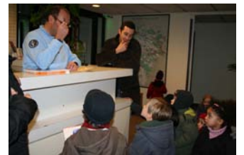
« Ouaah et en plus, on a eu des cadeaux avec Gendy le Gendarme! »