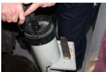
« Nous devons toujours décharger notre arme dans des tubes remplis de sable »

gendarmes utilisent des matraques télescopiques pour tenir à distance toute personne suspectée d'être dangereuse.