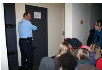
« Et voici une cellule de garde à vue. On y reste 2 ou 4 jours »