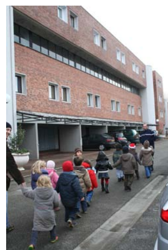
« Nous vivons dans la caserne avec nos familles »

On les met dans l'une de ces deux cellules (sans peinture au mur et avec seulement un lit, un matelas et des