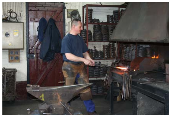
« Attention Monsieur le forgeron, c'est chaud ! »