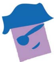
Le centre de loisirs « Le Château des pirates »

NOS AMIS... des centres de loisirs « Les p'tits Lutins » et « Le Château des pirates »