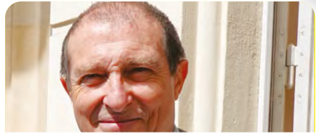
Médiane Système une société d'ingénierie innovante