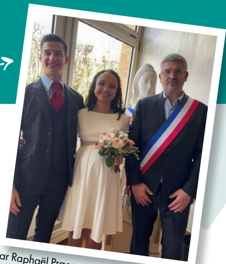
Par Raphaël Praca